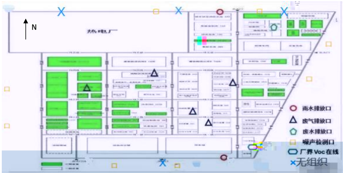
附：无组织检测点位